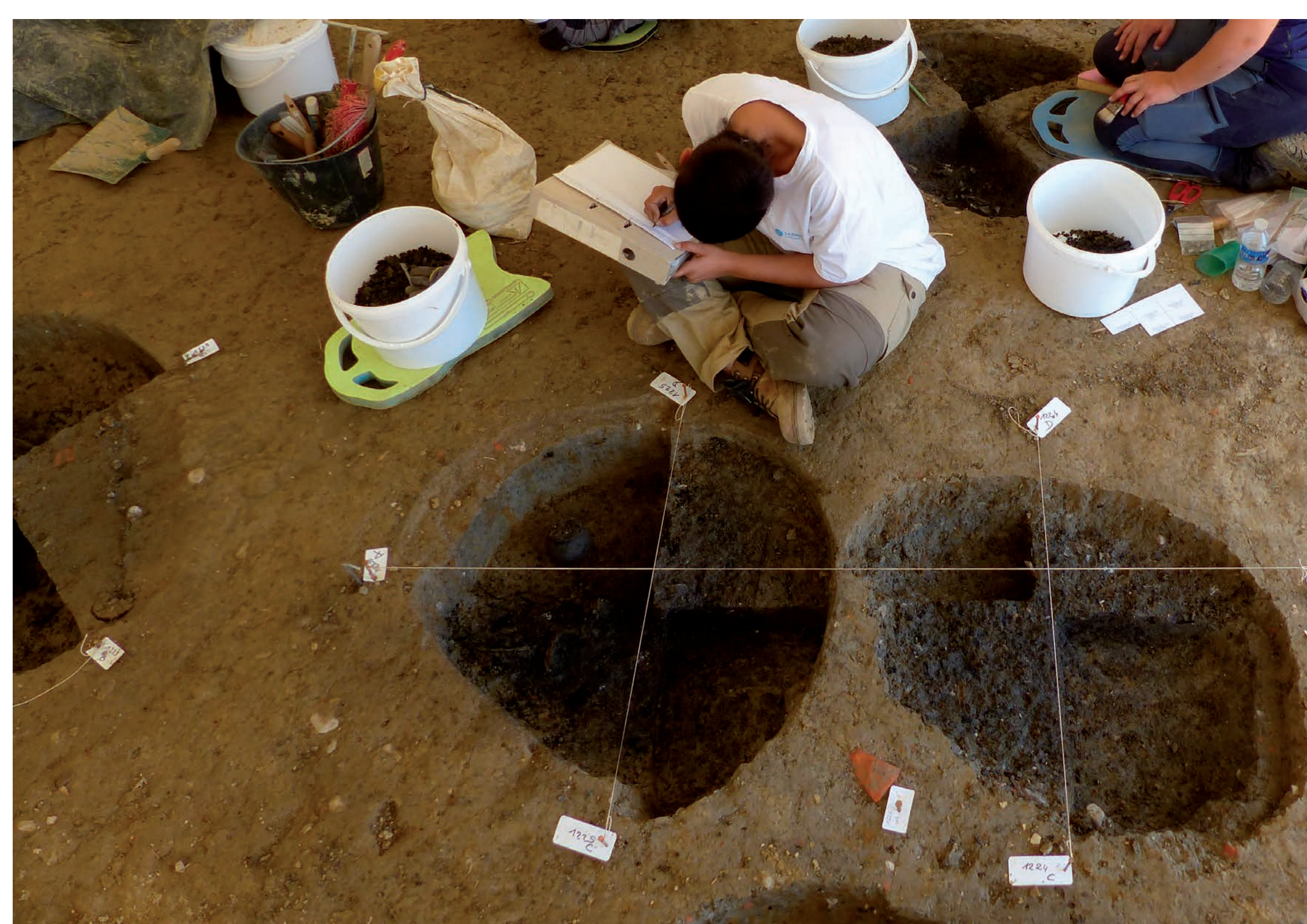
9 Étape 1

Les fragments d'objets brûlés retrouvés dans ces fosses permettent aux archéologues de connaître les objets qui accompagnaient le défunt sur le bûcher (les dépôts primaires). Ces éléments ainsi que les vases non brûlés placés auprès des cendres du mort (dépôt secondaire) leur permettent de reconstituer certains gestes effectués tout au long de la cérémonie funéraire.