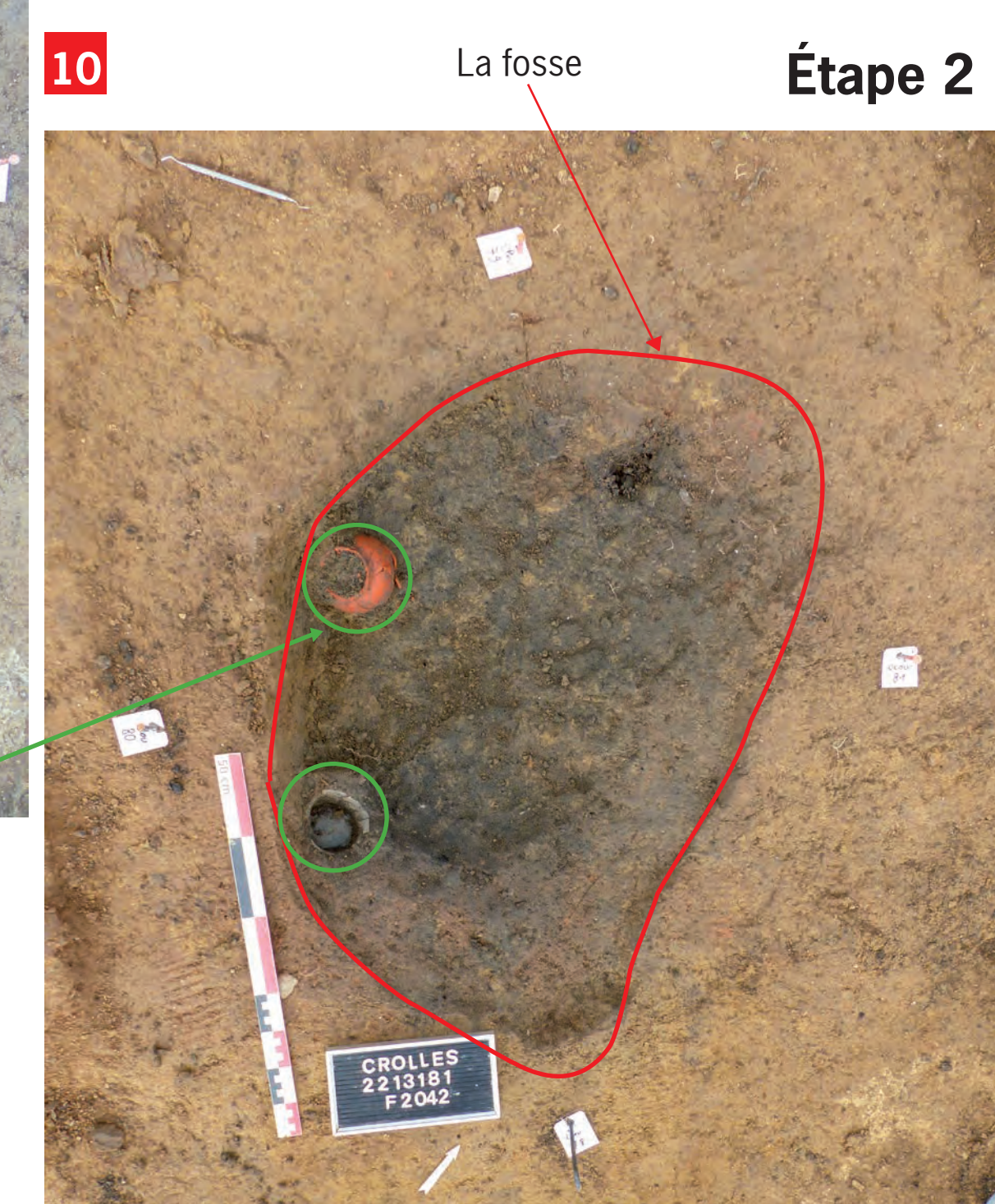
10 Étape 2

Les objets déposés dans la fosse (dépôt secondaire)